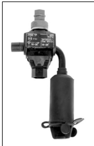
Rys. 1. Zacisk uziemiający TTD...-CCA